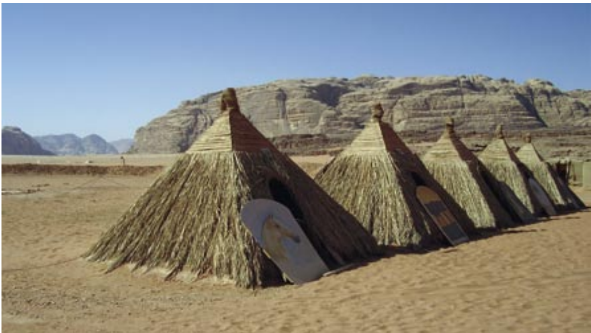
Eine Station der Erkundungsreise war das Naturschutzgebiet Wadi Rum in SüdJordanien

Auf den Spuren von Lawrence von Arabien ging es gemeinsam auf Jeep-Safari in die Wüste, übernachtete man in Zelten im Wadi Rum, saß gemeinsam am Feuer, lernte die Hymnen der fremden Nationen kennen, hörte die fremden Sprachen, aß ungewohntes Essen und sah fremdartige arabische Tänze. Ein weiteres Ausflugsziel war das