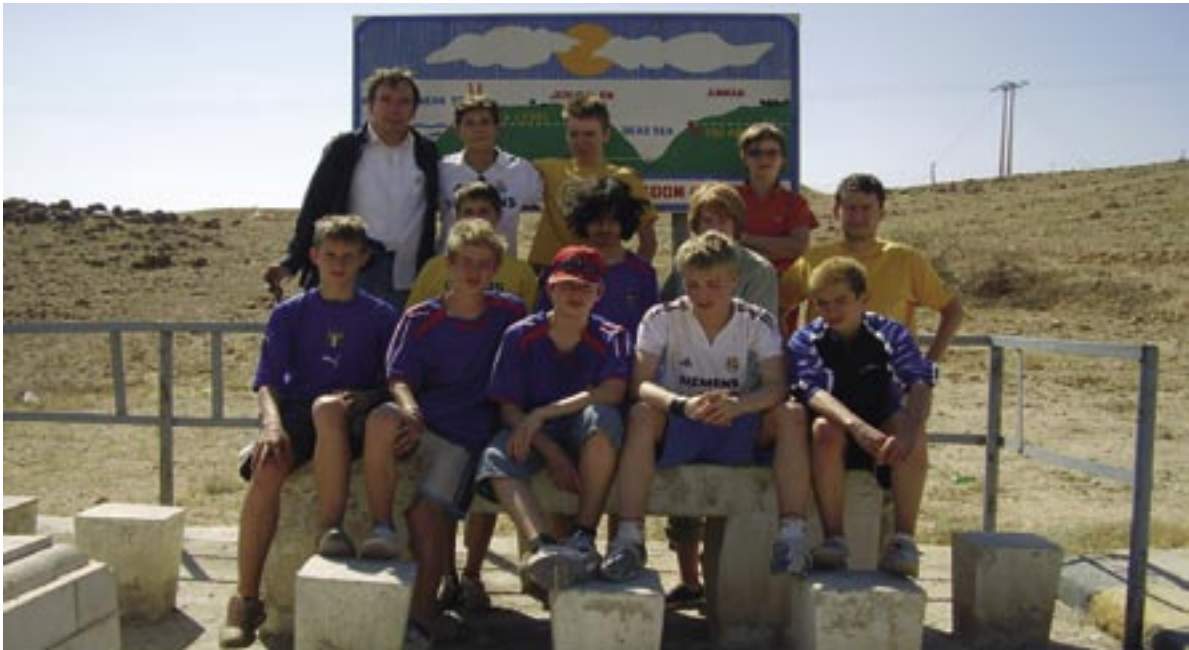
Die deutsche Gruppe aus Wetzlar und Künzell am Toten Meer

Gespielt wurde von den zwölf Mannschaften auf Kunstrasen im K.o.-System, aus dem die Schulmannschaft von Ruseifah/Jordanien als Sieger hervorging. Auffallend war das Gefälle in Alter und Ausbildungsstand der Schüler. Es gab sowohl Teams mit 14/15-jährigen als auch 17/18-jährigen, feste Fußballteams und nicht mannschaftsgebundene Schulteams (z. B. aus Deutschland). Auch wenn die sportlichen Ergebnisse nicht ganz den Erwartungen entsprachen – Künzell belegte den ehrenvollen zweitletzten Platz, Wetzlar scheiterte im Viertelfinale – war das Turnier in jeder Beziehung ein Erfolg. Nachdem der Deutsche Botschafter in