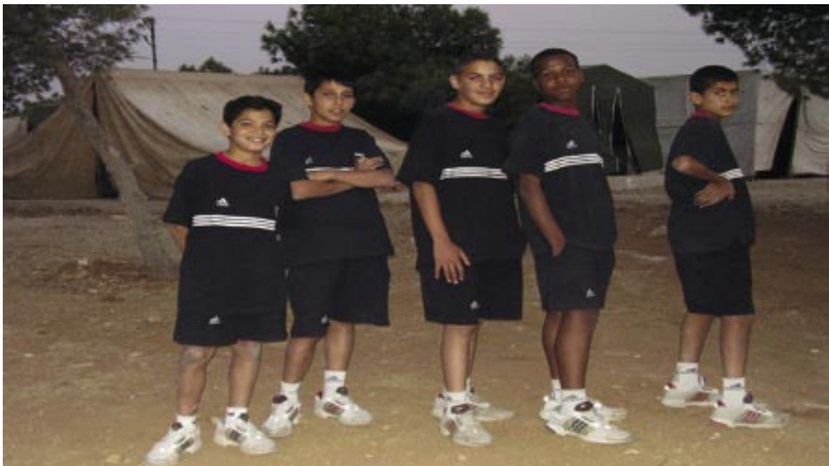
Das Team der „Jordan Football Association“