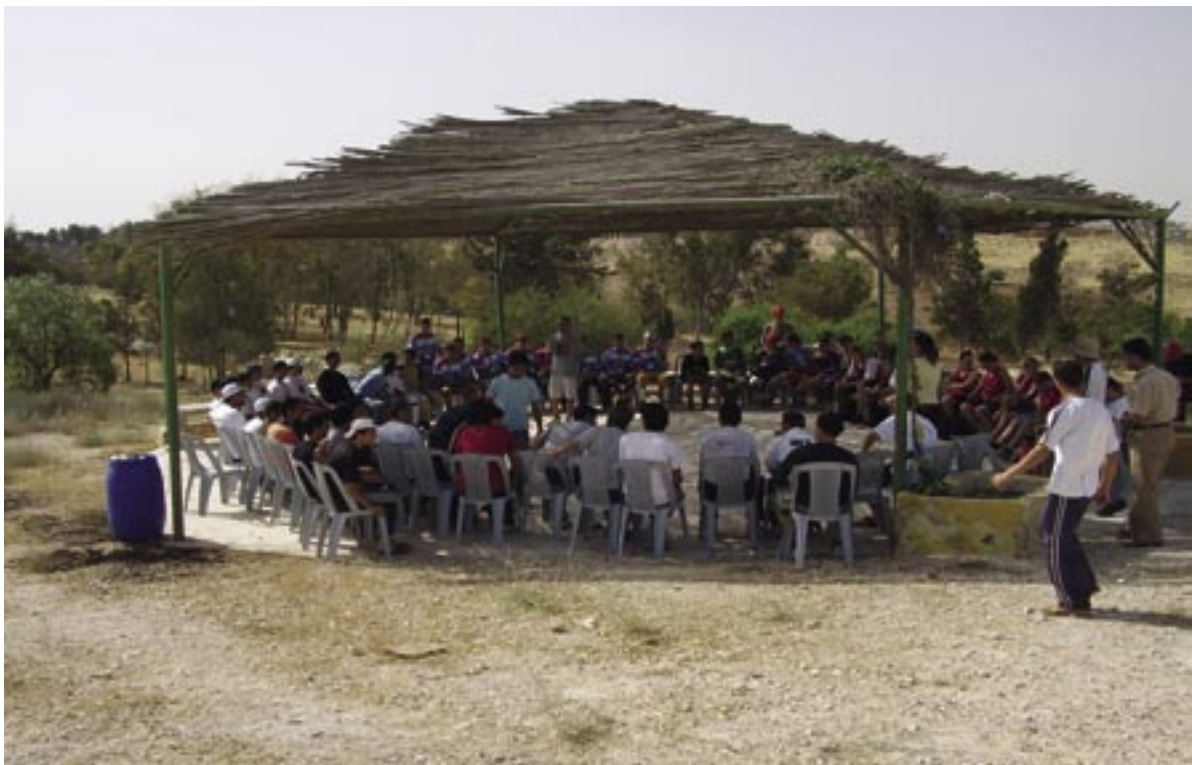
Besprechung der internationalen Teams im Camp der Schneller-Schule in Jordanien

Eben gerade erst unesco-projekt-schule geworden, war man auf höherer Ebene so begeistert von der Einsatzfreude der Rudolf-Steiner-Schule, dass man sie und die August-Bebel-Schule mit der Aufgabe betraute, Deutschland bei dieser innovativen Völkerbegegnung zu vertreten.