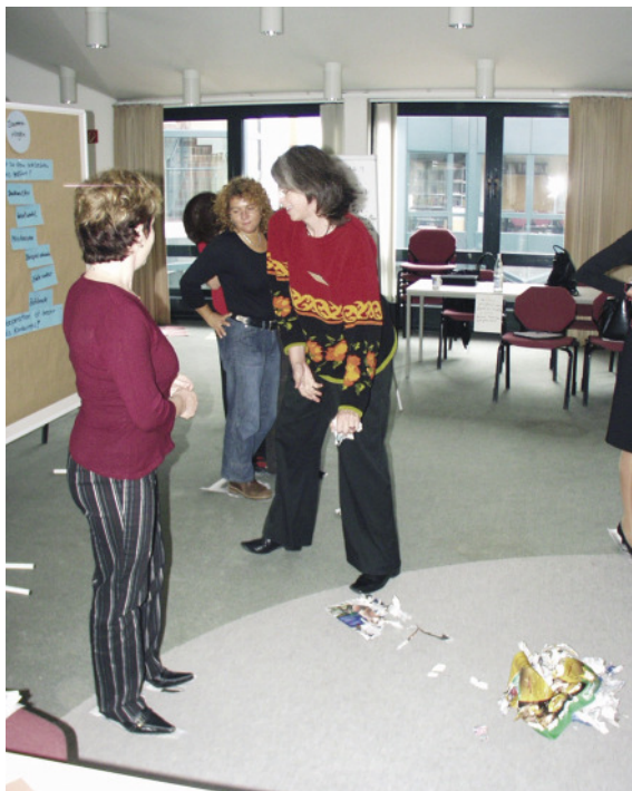
Die Wellen in Form der Spielleiterin schlagen zu und spülen TuvaluanerInnen ins Meer

Weitere Informationen (auch in Englisch) unter: http://de.wikipedia.org/wiki/Tuvalu