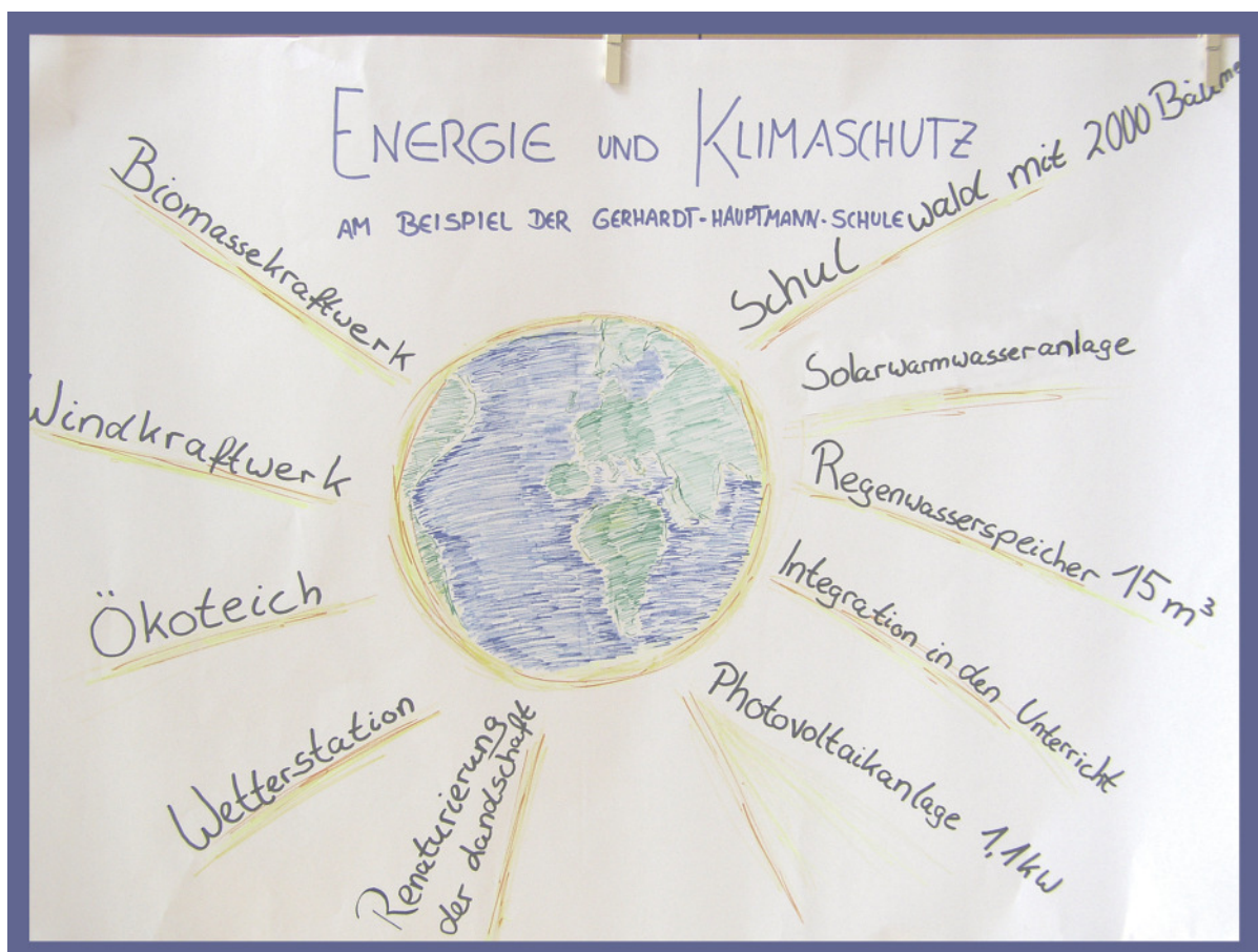
Energie und Klimaschutz am Beispiel der Gerhart-Hauptmann-Schule

Die Meteorologen und Ozeanographen versuchen hier, mit den Klimamodellen Antworten zu geben. Zum einen werden die Zusammenhänge des natürlichen Klimageschehens erforscht, zum anderen