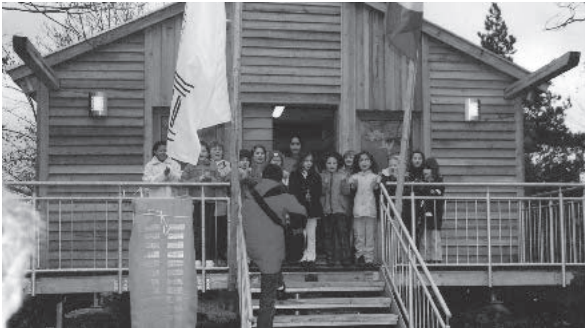
Ein grünes Klassenzimmer am Rand des Pausenhofes