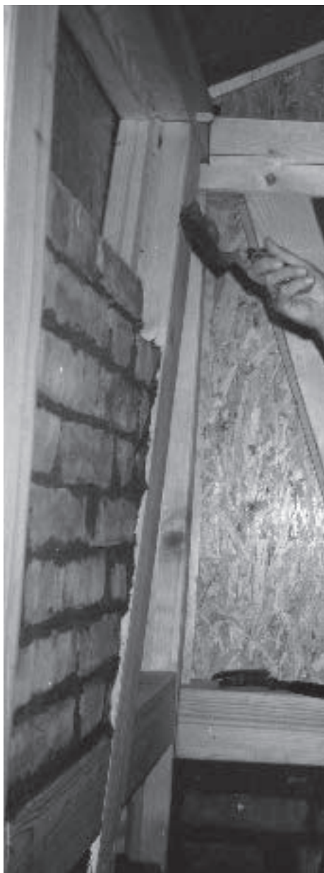
Tonsteine zwischen Holzbalken

Für die Lehmwände wurden als Grundmaterial ungebrannte, getrocknete Steine aus Ton im Format von einfachen Ziegelsteinen und Tonmehl mit geschrotetem Stroh benutzt. Aus letzterem wird mit Wasser unter geduldigem Rühren und Mischen eine streichfähige Masse hergestellt, die während des Aufsetzens der Steine als Kleber und Fugenfüller verwendet wird. Man arbeitet mit Kelle, Spachtel oder an kniffligen Stellen einfach mit den Händen, wie beim Töpfern. Es macht richtig