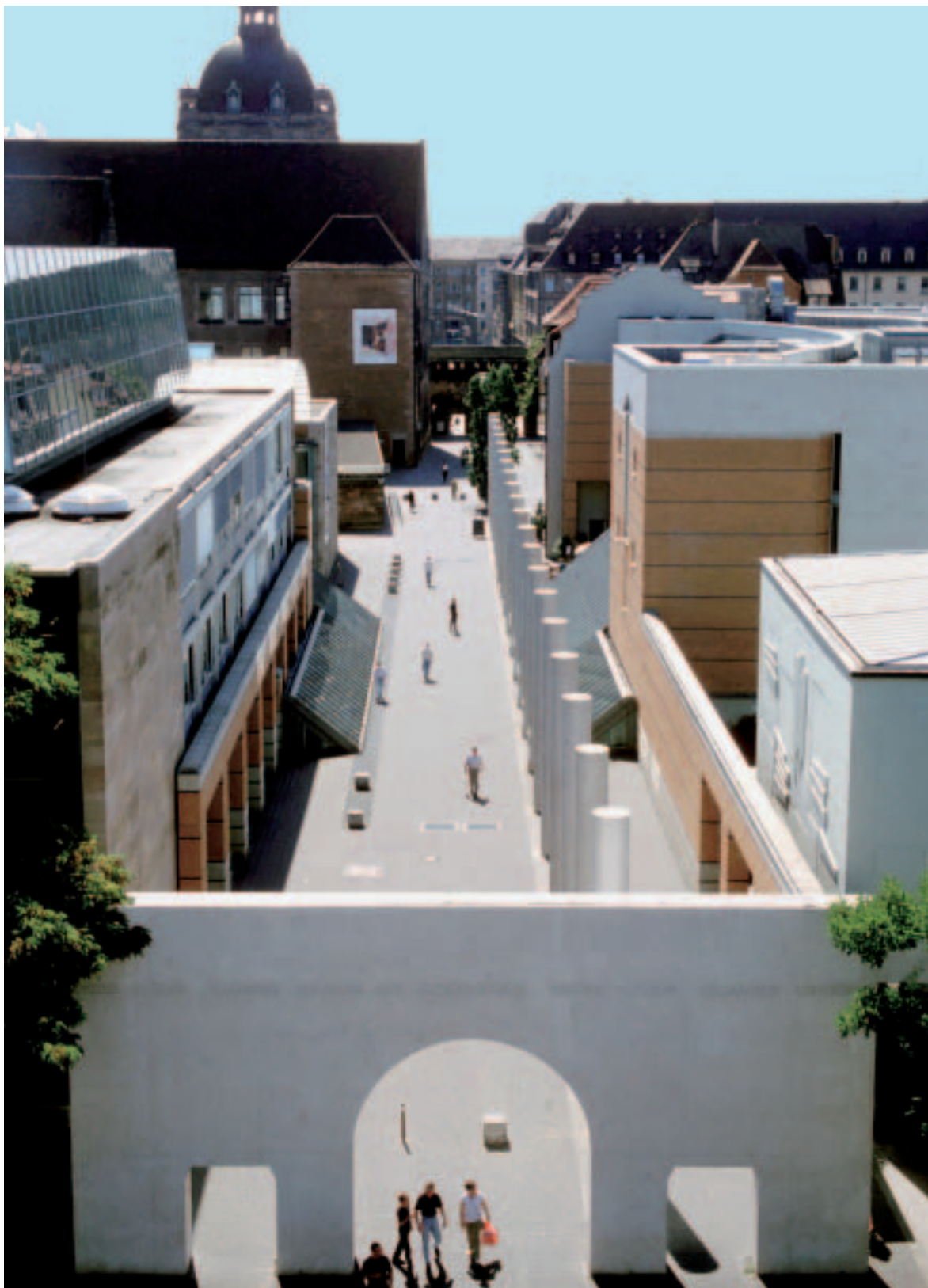
Straße der Menschenrechte in Nürnberg