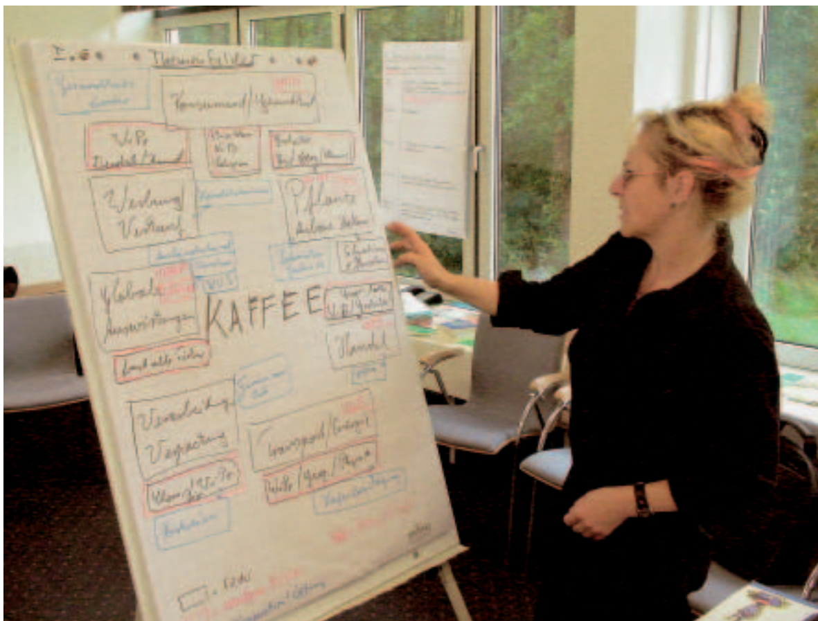
Auseinandersetzung mit dem Thema Kaffee in der Nachhaltigkeits-AG der Jahrestagung 2004