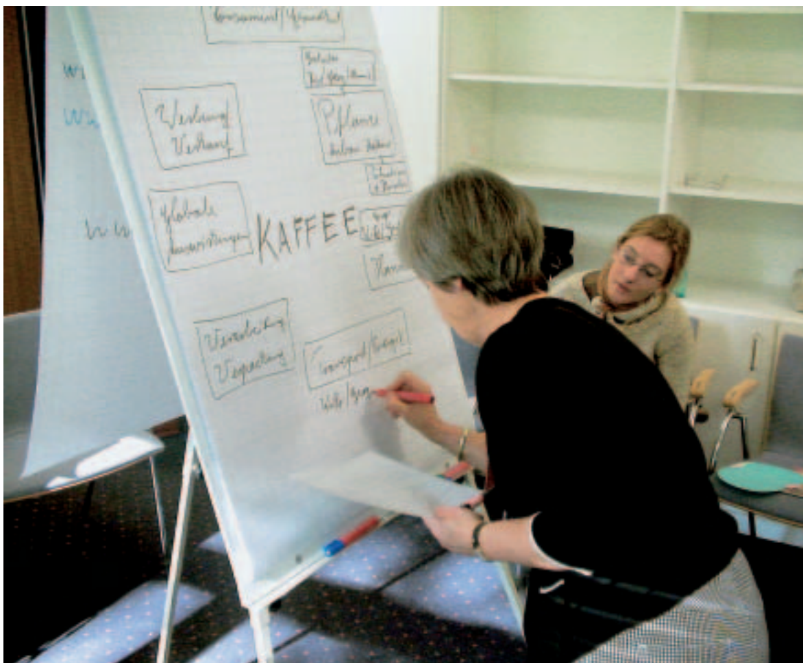
Arbeit am Kaffeeprojekt

Brot für die Welt, 2000, mit vielen Grafiken zum Kaffeehandel.