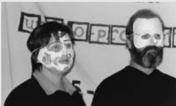
weitere Masken ...

Wenn ich weit weg fahre, lande ich doch immer wieder bei mir. Wie auf dem Gang durch die Wüste bin ich allein auf mich gestellt und bin manchmal erschrocken über die Einsamkeit. Einsam in Afrika, Asien, Amerika ist nur der Europäer. Neugierde schafft Gemeinsamkeiten, nimmt hinein in die andere Kultur. Dann sind die „Anderen“ so anders nicht mehr, aber doch anders genug, um nicht gleich zu sein. Jeder und Jede bleibt ein Individuum, eine eindeutige Zusammenstellung aus den Zutaten, in denen wir uns alle gleichen. Und sind wir alle „göttergleich“ aus Lehm geknetet, so ist die Sprache so verschiedenartig aus lippengleichen Mündern doch!