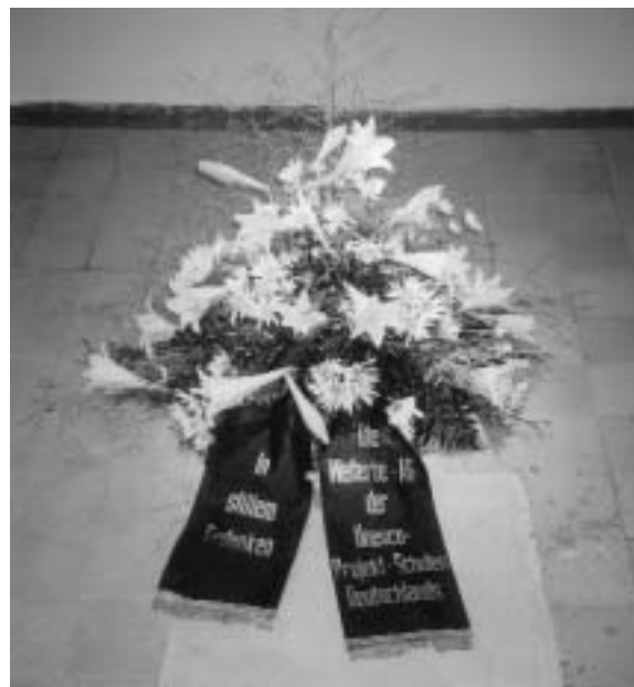
Kranzniederlegung in der Hinrichtungsstätte, JVA, Wolfenbüttel

Aus der Weite und Lebendigkeit der geistigen Vielfalt gelangte man nun plötzlich nach mehreren Schleusen in die hermetische Abgeschlossenheit dieser Anstalt. Es dauerte schon