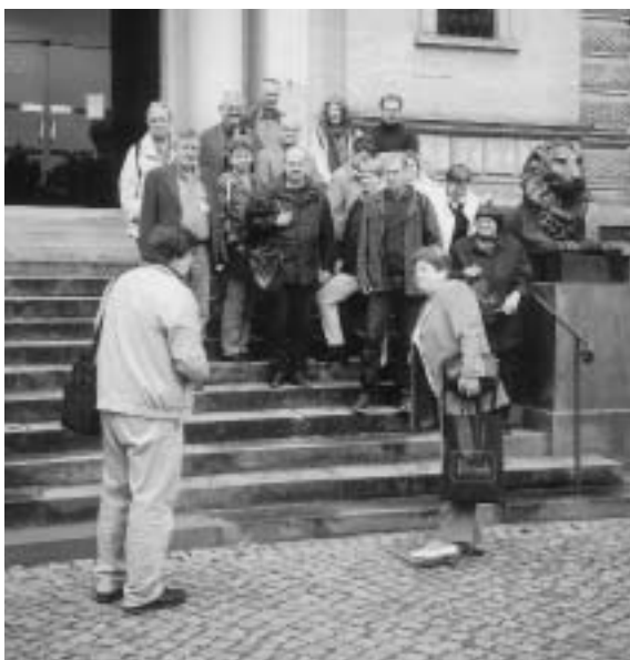
Am Eingang zur Herzog-August-Bibliothek, Wolfenbüttel

Zum Bedauern so mancher Bücherliebha- ber in der Welterbe-AG verging hier zwischen