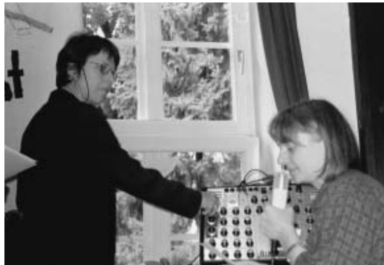
Klänge aus dem Synthesizer – offenbar nicht von dieser Welt

Musik ein kleines Stück näher gekommen. In der anschließenden Vorstellung seiner technischen Möglichkeiten legt der Professor los. In mitten von Mikrofonen, Synthesizern, Modulationsgeräten, Fußschaltern und einem beängstigenden Kabelsalat führt er – seine Flöten und technischen Geräte im Fluge wechselnd – vor, was „Zeitgenossen“ so können – und das ist sehr viel: Sich ineinander verschachtelnde Klangteppiche, klingende Kaskaden von der Piccolo-Flöte erzeugt, Basstöne im Orgelformat und verzerrte E-Gitarren-Soli, die einem Jimmy Hendrix zur Ehre gereichen könnten – von der Altflöte erzeugt.