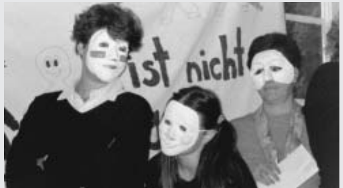
Die Theatergruppe bei der Schlusspräsentation

Am Anfang war das Wort – also verständigen wir uns und fahren mit dem Unterschied jetzt fort!