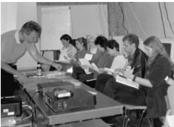
Ob sich ein Rechtsradikaler durch Udo Lindenberg beeindruckten lässt?

Medieninitiative der Wochenzeitung „Die Zeit“ mit Beteiligung des „SPIE-