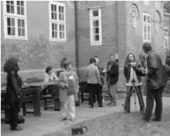
Zum Glück spielt das Wetter mit – erste Schritte in der Kunst, ein Video zu produzieren

GEL“, der Frankfurter Rundschau, der taz und der BILD-Zeitung