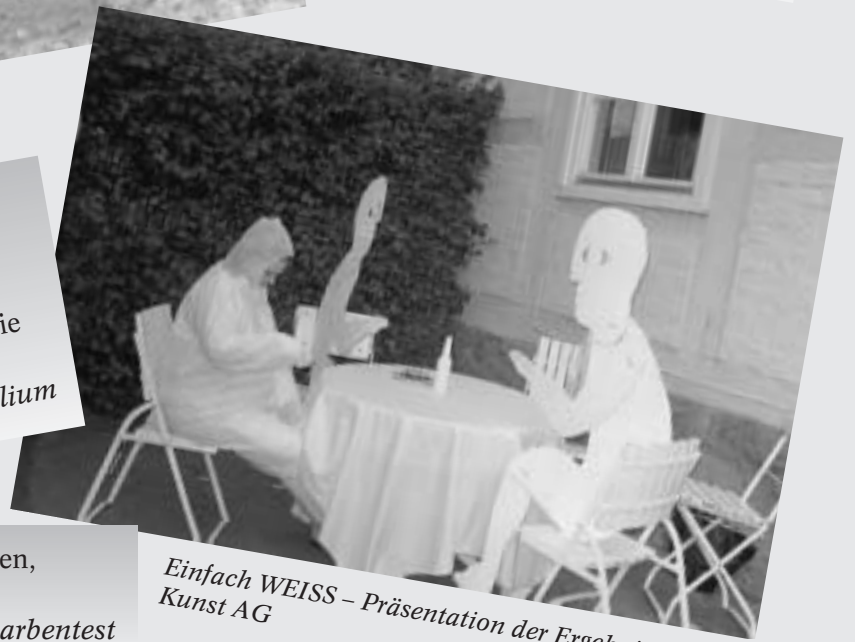
Einfach WEISS – Präsentation der Ergebnisse der Kunst AG

Weiß bedeutet allgemein „Aufheben, Löschen, Enthemen“.