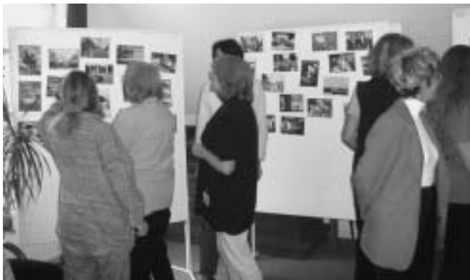
Die „Toleranten“ bauten extra eine Fotowand auf

Aber die magische Zeitgrenze 10:30 Uhr rückt immer näher, und siehe da, als ich abermals die Rechtsradikalismus-Faschismusgruppe besuche, ist der Referent schon da und trägt mit seiner Gitarre Lieder mit dazu passender Problematik vor. Das gibt gute Fotos!