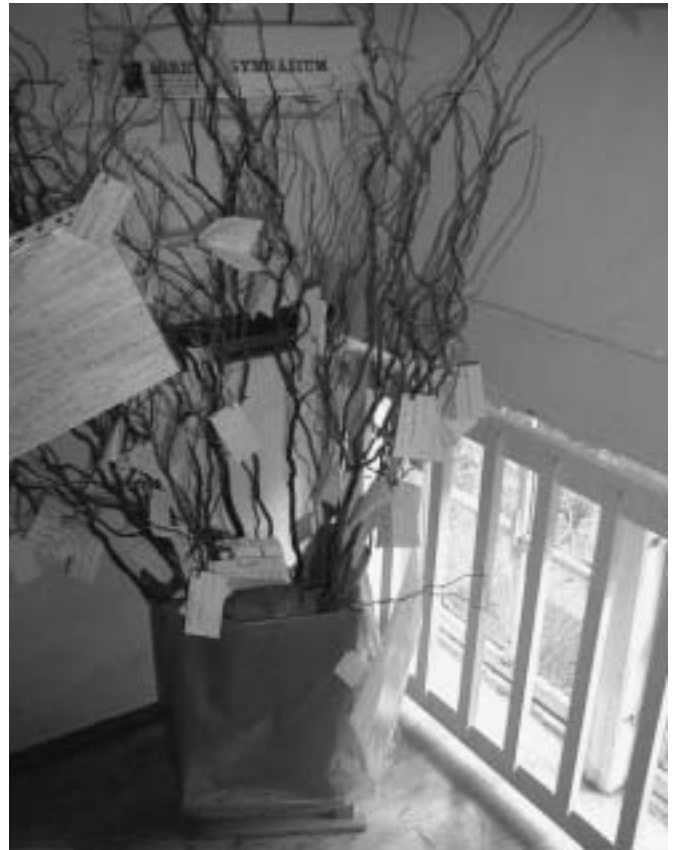
Ein „Miteinanderbaum“ – Ergebnis des 4. Internationalen Projekttagess

Die AG Nummer 6 mit dem Thema „Welt-erbe – Zwei Seiten einer Medaille“ ist gerade leider gar nicht da. Sie unternimmt eine ganztägige Exkursion nach Wolfenbüttel. Hier kann ich also keine Fotos machen. Was nun? Wo mich doch alle gebeten haben, später zu kommen. Ich sollte doch nicht so viel Kaffee trinken, schon wieder Pause, und Hunger habe ich auch nicht. Auf dem Rasen entdecke ich eine Gruppe von Leuten, die mit einer