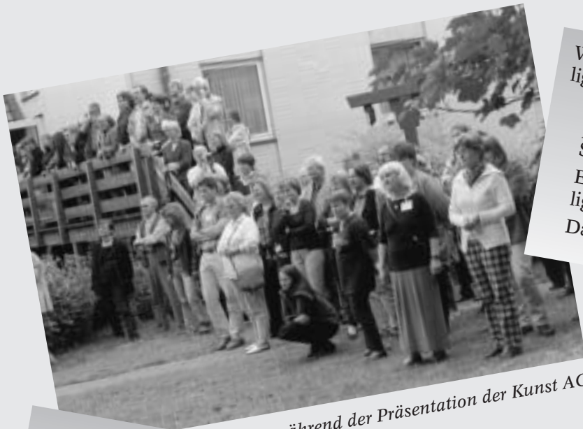
während der Präsentation der Kunst AG

„... Gott hat die zulängliche Einsicht und Macht, das Viele zu Einem zusammenzuschließen und es aus dem Einem wieder in Vieles auszulösen, wogegen es keinen Menschen gibt oder jemals geben wird, der imstande wäre, das eine oder andere zu vollbringen.“ Platon