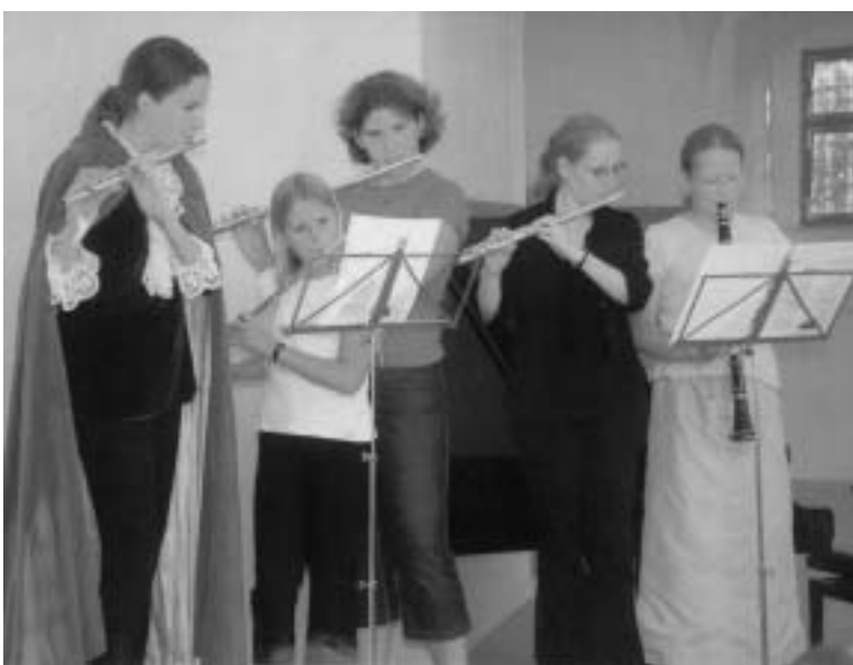
Schüler der St. Bonaventura-Realschule auf der Landestagung in Dillingen