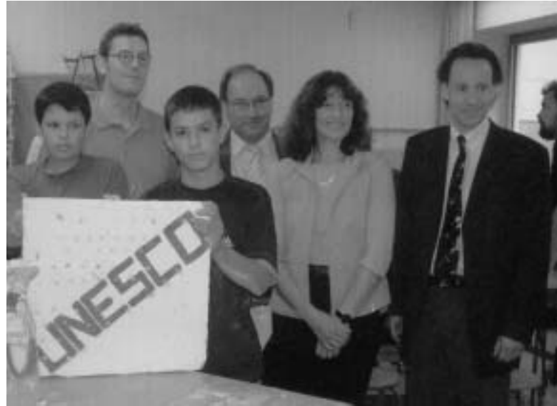
Alte und neue Koordinatoren

In den vergangenen Jahren entwickelte die Landeskoordination eine eigene Form der Vernetzung: Im Frühjahr eines Kalenderjahres wird eine Lehrerfortbildung angeboten, die derzeit in Zusammenarbeit mit dem Staatsinstitut für Schulpädagogik und Bildungsforschung und dem Bildungswerk der Hanns-Seidel-Stiftung durchgeführt wird. Diese wird praxisorientiert zu einem Jahresthema angeboten. Es können auch Lehrkräfte, die nicht an unesco-projekt-schulen unterrichten, teilnehmen.