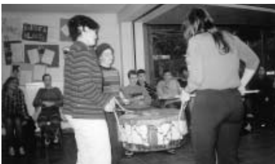
Präsentation des Musikworkshops

Der Musikworkshop beschäftigte sich mit dem Einstudieren von internationalen Liedern, wohingegen es im Theaterworkshop schon etwas ernster wurde, indem man Konfliktsituationen nachspielte und dabei den Status der einzelnen Personen veränderte. Eher dokumentarische Aufgaben hatten hingegen der Video- bzw. Homepageworkshop, bei dem beide Gruppen das Geschehen der Woche in Bildern festhielten oder die Erlebnisse und Eindrücke niederschrieben.