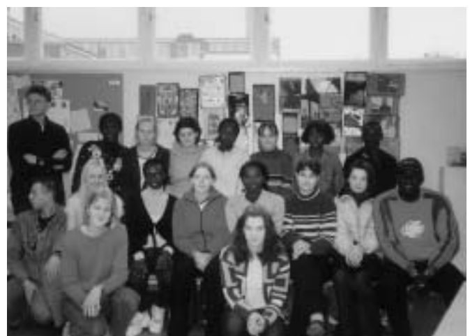
Kunst, die uns verbindet – die Teilnehmer/innen nach getaner Arbeit

Eine Partnerschaft bedeutet, Neues bzw. Unbekanntes über beide Regionen zu erfahren. Aus dem Unterricht kannten die Schüler bereits etwas von Frankfurt(Oder) und der deutschen Geschichte, hier war aber alles hautnah zu erleben und zu entdecken. Wir waren überrascht, wie viel sie bereits über die Oder-Neiße-Grenze wussten. Nur stellten sie sich die Oder viel größer vor. Ihre Lehrer meinten, dass sie so breit wie ihr Fluss in Ziguinchor wäre, aber sie mussten sich eines Besseren belehren lassen. Dies zeigte uns,