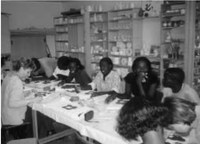
Gemeinsame Freizeit in der Töpferwerkstatt