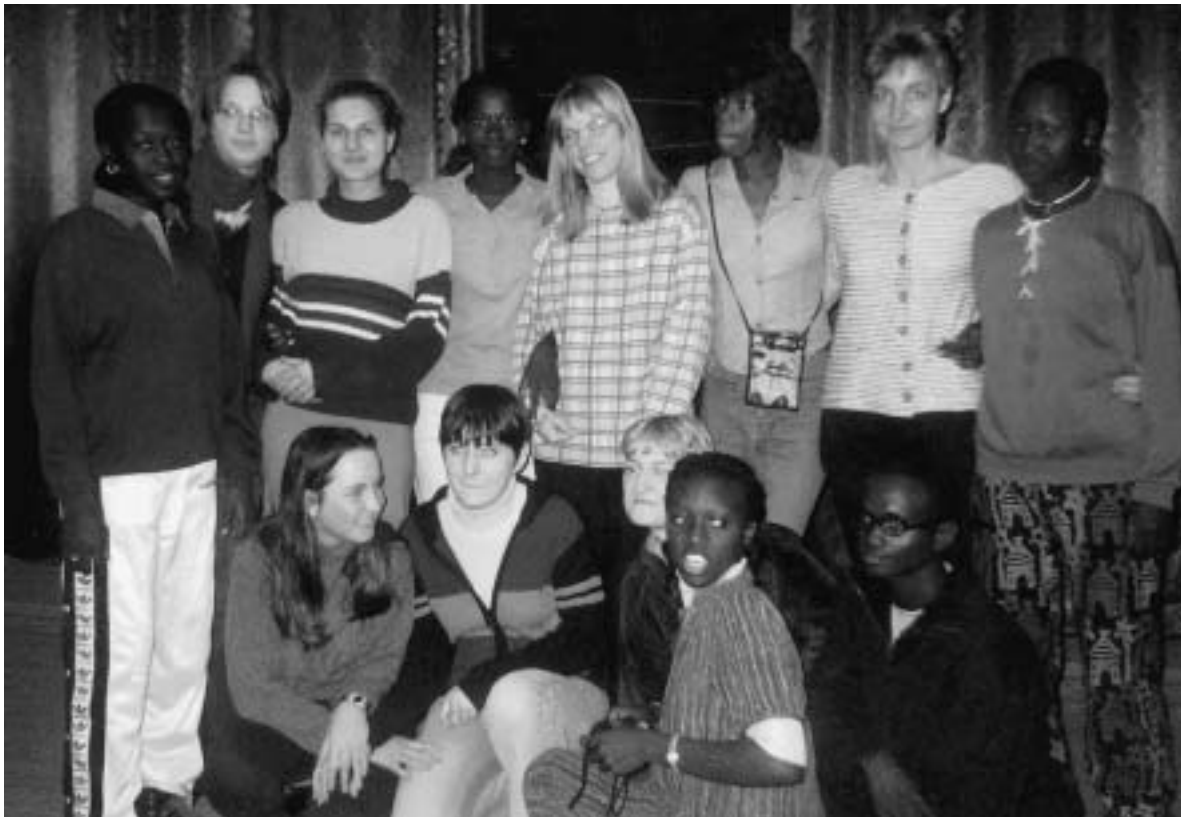
TeilnehmerInnen des Austauschprogramms

Motiviert, unser Projekt fortzusetzen, wurden wir auch von der senegalesischen Bot-