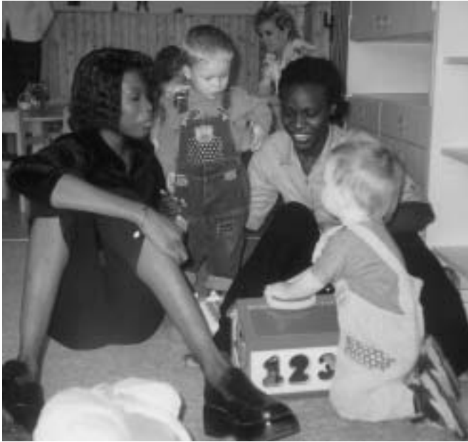
Aufwachsen in Deutschland – Besuch im Kindergarten

dass auch die Schüler ab und zu mehr wissen als ihre Lehrer und das brachte uns doch alle beim Stadtrundgang zum Lachen.