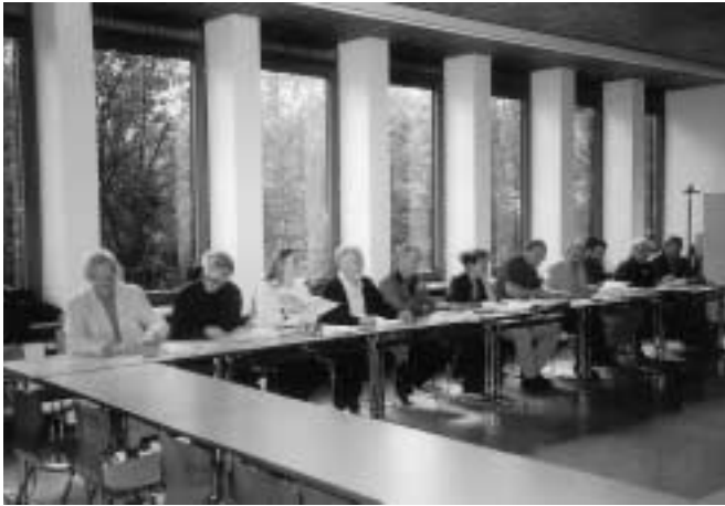
Regionalkoordinator/innen bei der Arbeit

stellt das überkommene geographiedidaktische Prinzip „vom Nahen zum Fernen“ auf den Kopf. Aber auch in einer weiteren Hinsicht ist der didaktische Ansatz „meine Stadt in der Welt – die Welt in meiner Stadt“ wegweisend, kann er doch deutlich machen, dass wir über sinnliche Erfahrungen und Erkundungen im Nahraum zur Erkenntnis abstrakter, komplexer weltweiter Zusammenhänge geführt werden können. Das Erlernen einer globalen Anschauungsweise darf keinesfalls mit einer Vogelperspektive verwechselt werden. Genauso wenig wie die Globalisierung eine einheitliche Welt hervorbringt, sondern eine vielfach gebrochene Welt, kann das Anliegen, eine globale Anschauungsweise zu realisieren, mit der Unterstellung einer ein-