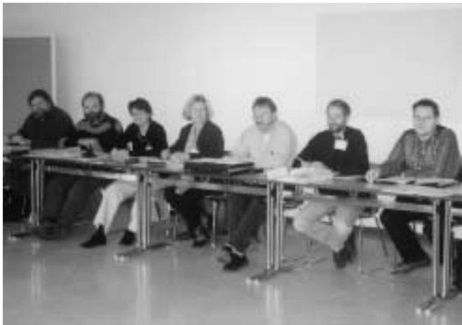
Regionalkoordinator/innen bei der Arbeit

tungen Lernen organisiert und wie Forschung betrieben wird, mit dazu beiträgt, jene Geisteshaltung zu befördern, die die Welt in die globalen Probleme hineingeführt hat. Paradoxerweise geht doch gerade von jenen reichen Gesellschaften des Nordens das größte ökologische Gefahrenpotenzial aus, die über die bestausgestatteten Bildungssysteme und die meisten Lehrer, Wissenschaftlerinnen und Professoren verfügen. Die Erforschung der pädagogischen Mitverantwortung an den weltweiten Fehlentwicklungen ist ein erziehungswissenschaftlich noch weitgehend unbeackertes Feld.