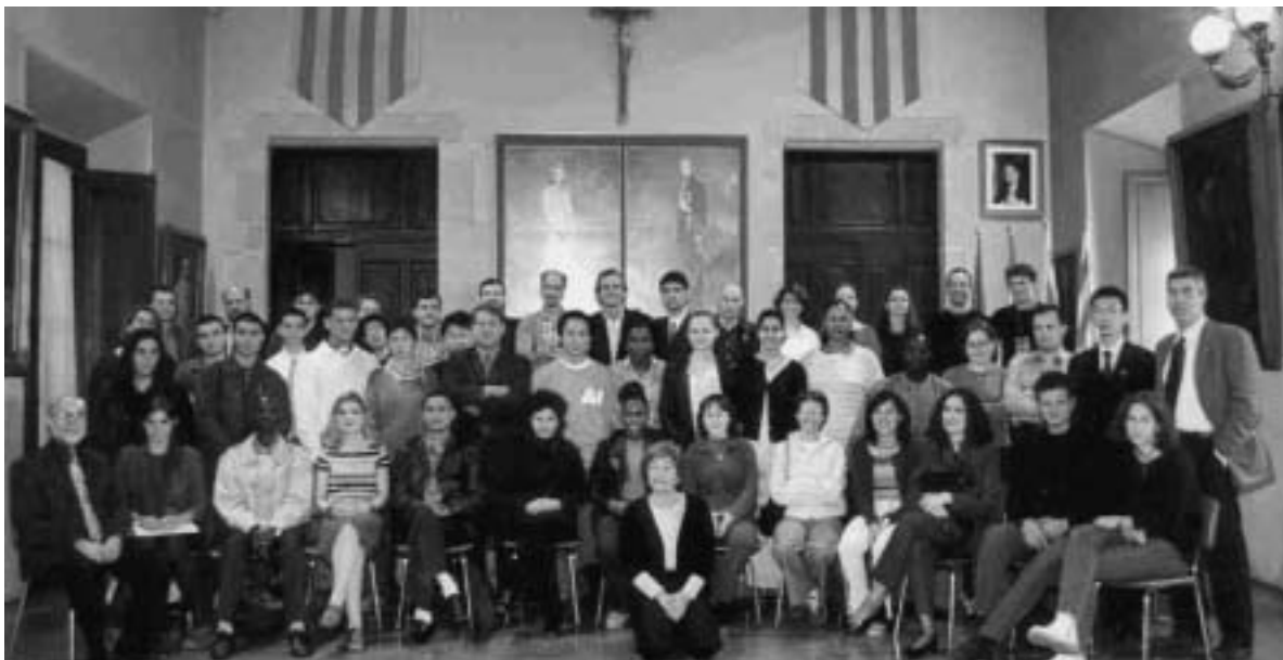
The participants of the UNESCO World Youth Encounter

In our workshops we focused on our common values and ideas as a basis for discussion and future projects.