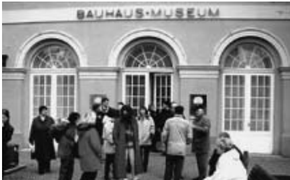
Auf den Spuren des Bauhauses

„Interkulturelles Lernen“ war das Thema des diesjährigen Regionaltreffens der Thüringer unesco-projekt-schulen vom 8.–10. März in Weimar. Passend zur Thematik, denn schließlich lebten und wirkten wir bis vor wenigen Jahren in zwei verschiedenen Kulturen derselben Nation, nahmen an diesem Treffen zu unserer Überraschung und Freude kurz entschlossen auch die Kolleginnen und Kollegen der hessischen unesco-projekt-schulen teil, mit welchen uns schon seit geraumer Zeit ein enges, herzliches und produktives Netzwerkverhältnis verbindet.