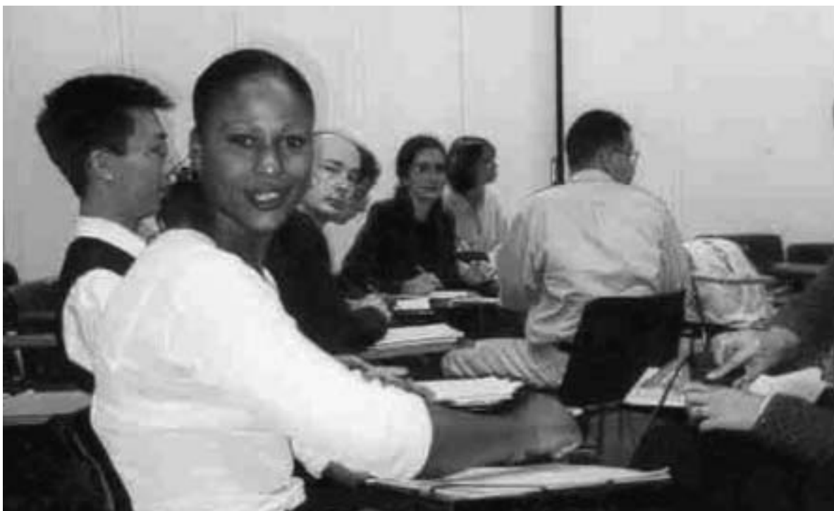
Dialogue between civilisations

Jo-Jana Desoi Anna-Schmidt-Schule Frankfurt am Main