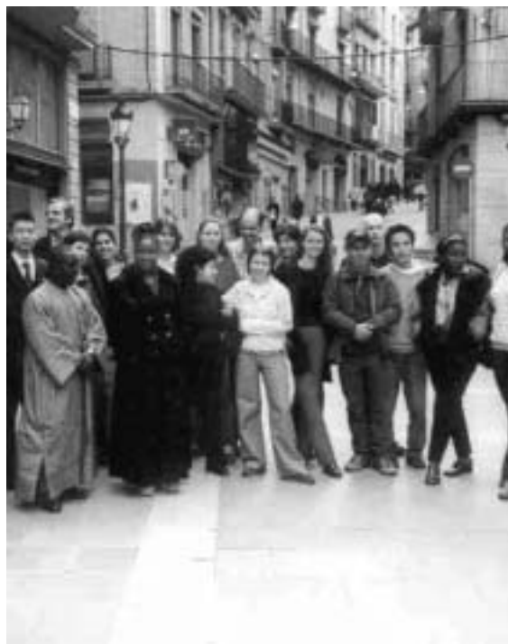
Learning about each other cultures

While discussing this issue we figured out that the fields of values are differently emphasised in the world's countries. The group couldn't come up with a clear definition of what civilisation means but the question led us into interesting considerations and discussions. Huntington's model of civilisations, for example, was not similar to what the participants feel concerning their civilisations. Huntington divides the world into a Western, an Orthodox, an Islamic, a Confucianist, a Buddhist, a Japanese, an African and a Hindu civilisation. The group came up with links between those civilisations and finally finished the discussion with more question than answers but