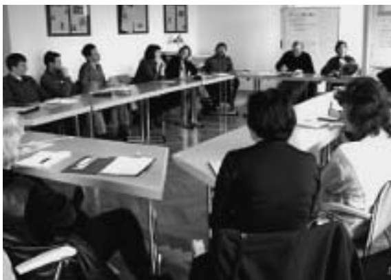
Interkulturelles Lernen theoretisch

Von zwei kompetenten und sympathischen Trainerinnen für interkulturelles Lernen wur-