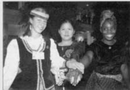
Für die Teilnehmer der »Unesco-Summer-School« gab es trotz ihrer unterschiedlichen Herkunft – die Mädchen auf dem Bild stammen aus Afrika, Asien und Europa – keinerlei Verständigungsschwierigkeiten.

Verpackungsmaterialien, die im Alltag keine Verwendung finden und in der Papiertonne landen.