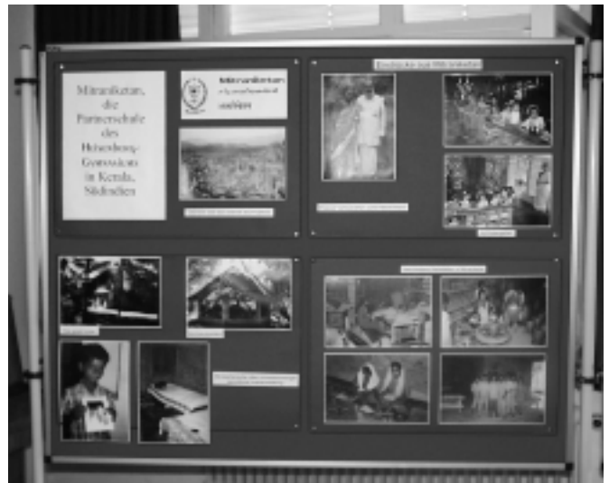
Präsentation des Partnerobjekts des Heisenberg-Gymnasiums Karlsruhe

Die Übergabe des Staffelholzes fand im Rahmen des Sternlaufs der deutschen unesco-projekt-schulen statt. Ziel dieses Laufes, der zum 3. Internationalen Solidaritätstag (Thema: Agenda 21, Kultur des Friedens) am 5. Juni 2000 veranstaltet wurde, war Leipzig, wo eine zentrale Abschlußveranstaltung stattfand.