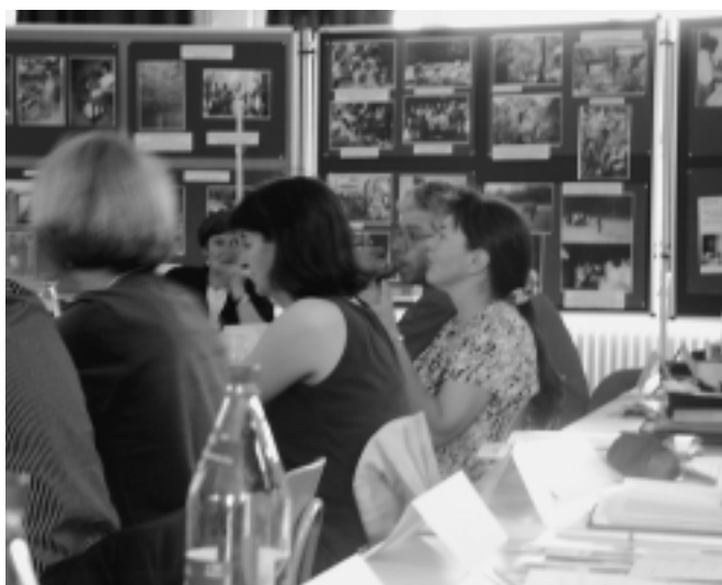
Blick in den Teilnehmerkreis

Die Mädchenwerkstatt Girls do it ist ein Projekt der offenen Jugendarbeit und Jugendsozialarbeit zur Unterstützung für Mädchen in der Berufsorientierung. Haupt- und Förderschülerinnen ab 12 Jahre haben hier die Möglichkeit, über die Arbeit mit Materialien wie Metall, Plexiglas, Holz, etc. ihre Selbstwahrnehmung und Selbsteinschätzung zu fördern, was ihnen für die Berufsorientierung und Lebensplanung dienlich sein wird.